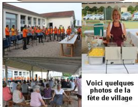
Voici quelques photos de la fête de village